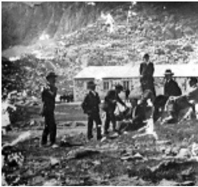
MINAS DE ÁLIVA, PICOS DE EUROPA. FINALES DEL XIX.

A JESÚS DE MONASTERIO HAY QUE ATRIBUIRLE LA RESPONSABILIDAD DE IMPULSAR LA MÚSICA SINFÓNICA ROMÁNTICA Y EL REPERTORIO DE COMPOSICIONES DE CÁMARA EN NUESTRO PAÍS, EN UN MOMENTO EN EL QUE ESTE GÉNERO ERA PRÁCTICAMENTE INEXISTENTE EN ESPAÑA Y EXISTÍA UN RETRASO DE MÁS DE SESENTA AÑOS CON RESPECTO A EUROPA. ESTA ACTUALIZACIÓN MUSICAL VINO MARCADA POR LA DEMANDA CULTURAL DE LA NUEVA BURGUESÍA ACOMODADA. NO ES ATREVIDO, POR TANTO, ASEGURAR QUE LA ACTUAL SITUACIÓN QUE VIVE LA MÚSICA DE CÁMARA EN NUESTRO PAÍS SENTÓ SUS BASES CON LAS INICIATIVAS EMPRENDIDAS, ENTRE OTROS, POR JESÚS DE MONASTERIO.