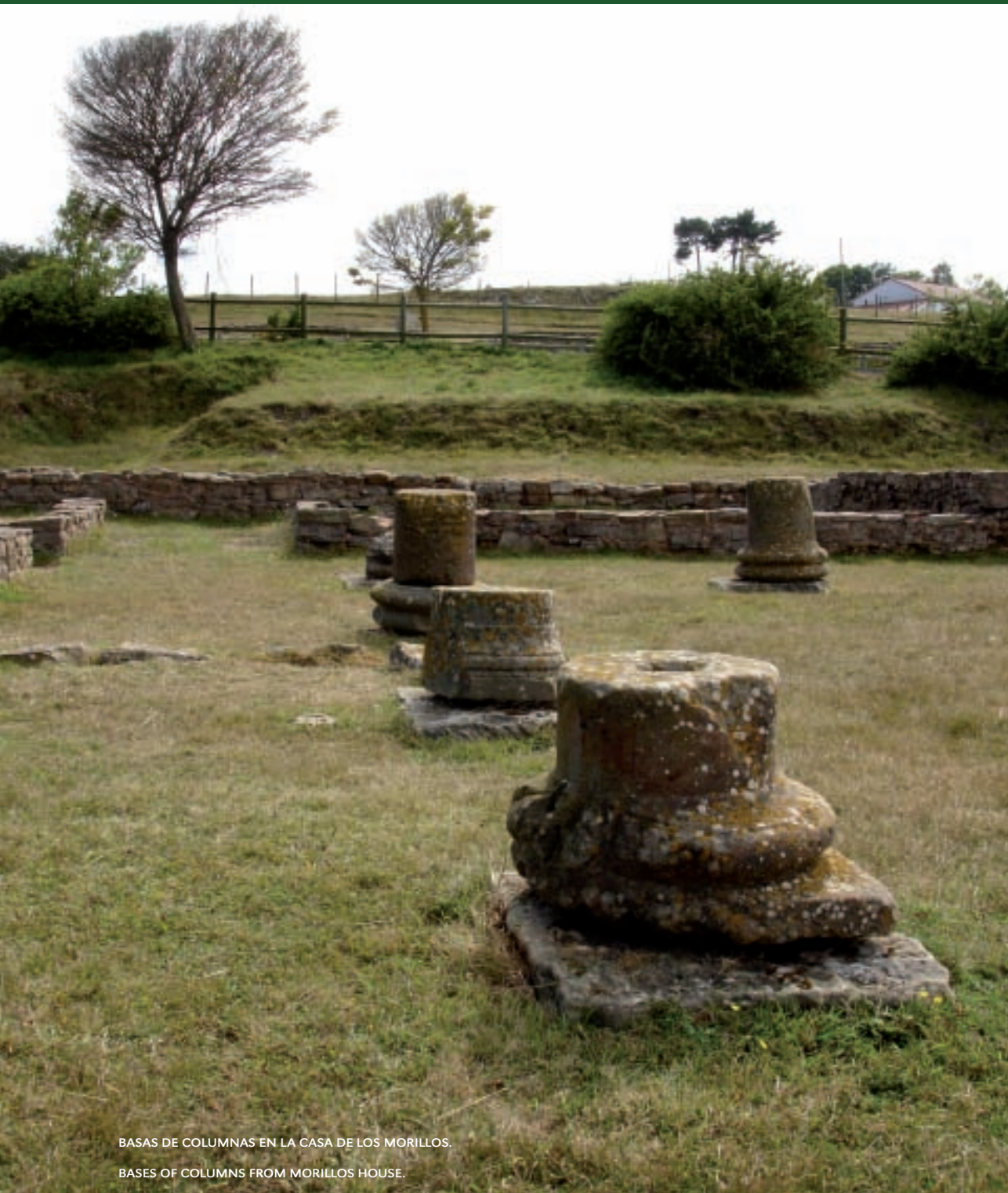
BASAS DE COLUMNAS EN LA CASA DE LOS MORILLOS.