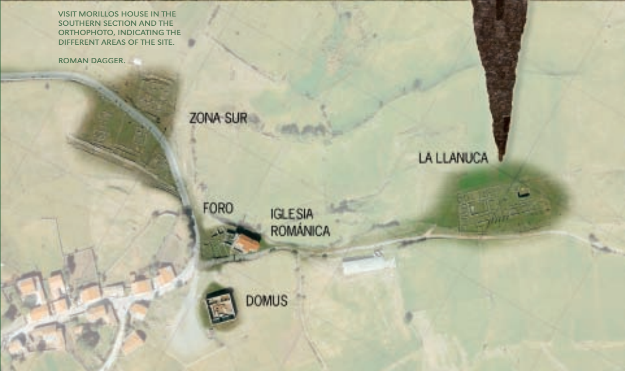
VISIT MORILLOS HOUSE IN THE SOUTHERN SECTION AND THE ORTHOPHOTO, INDICATING THE DIFFERENT AREAS OF THE SITE.