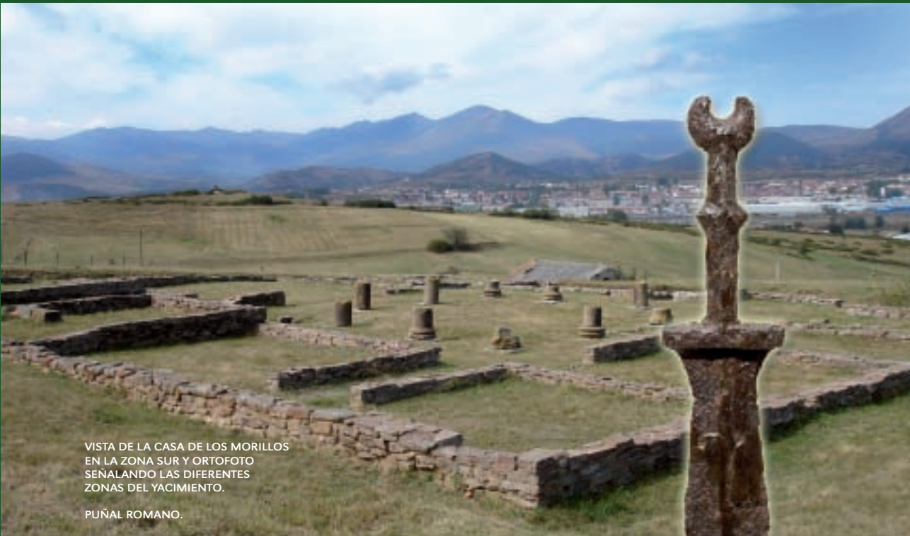
VISTA DE LA CASA DE LOS MORILLOS EN LA ZONA SUR Y ORTOFOTO SEÑALANDO LAS DIFERENTES ZONAS DEL YACIMIENTO.