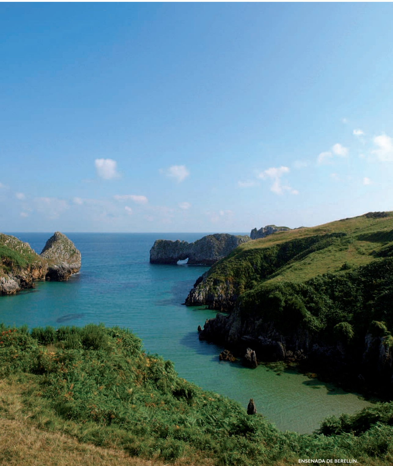
ENSENADA DE BERELLÍN.