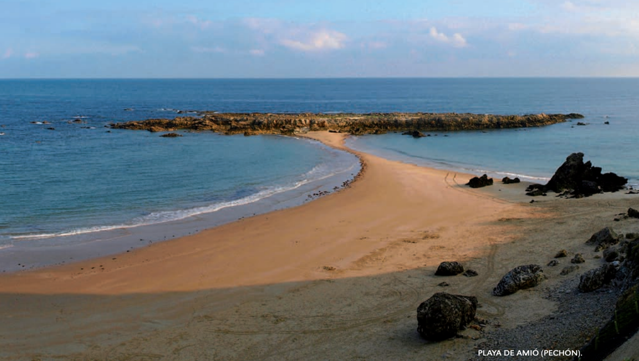
PLAYA DE AMIÓ (PECHÓN).

Por último, retomamos la vista sobre el Deva en el cercano mirador de Santa Catalina, que ofrece una de las panorámicas más espectaculares de toda Cantabria. |