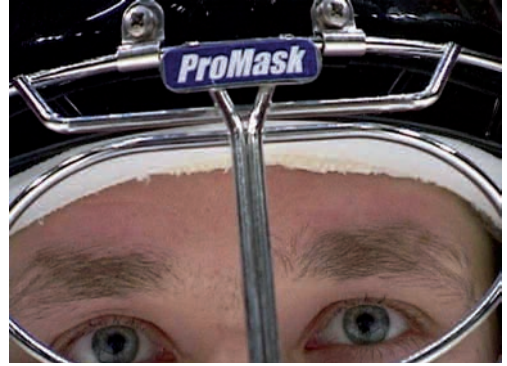
MICHEL NAJJAR, FRAGMENTO DE NETRÓPOLIS , 2008. 59,4 X 42 CM. FOTOGRAFÍA SOBRE PAPEL.