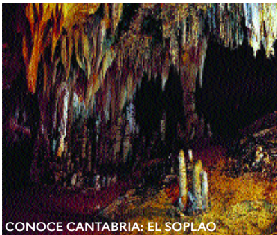
CONOCE CANTABRIA: EL SOPLAO