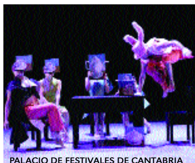
PALACIO DE FESTIVALES DE CANTABRIA