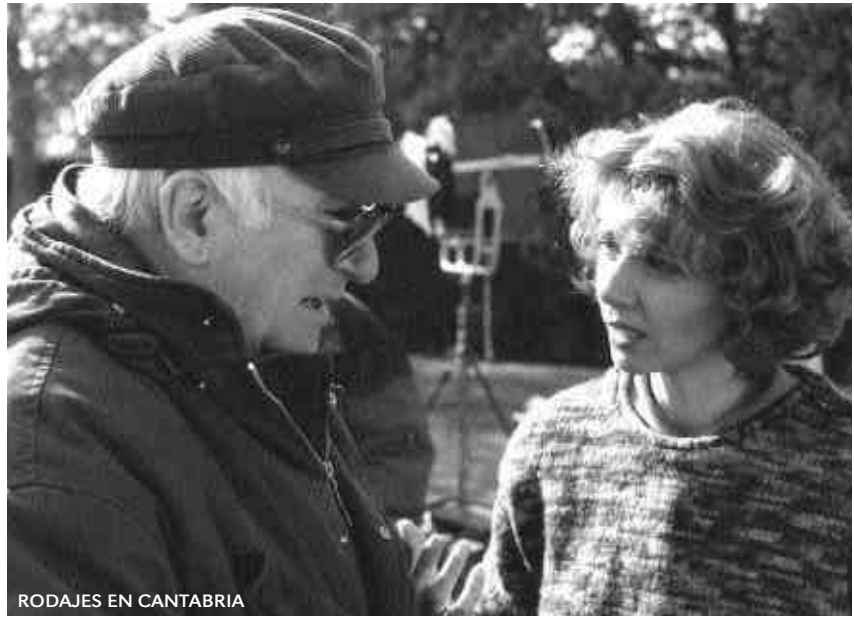
RODAJES EN CANTABRIA