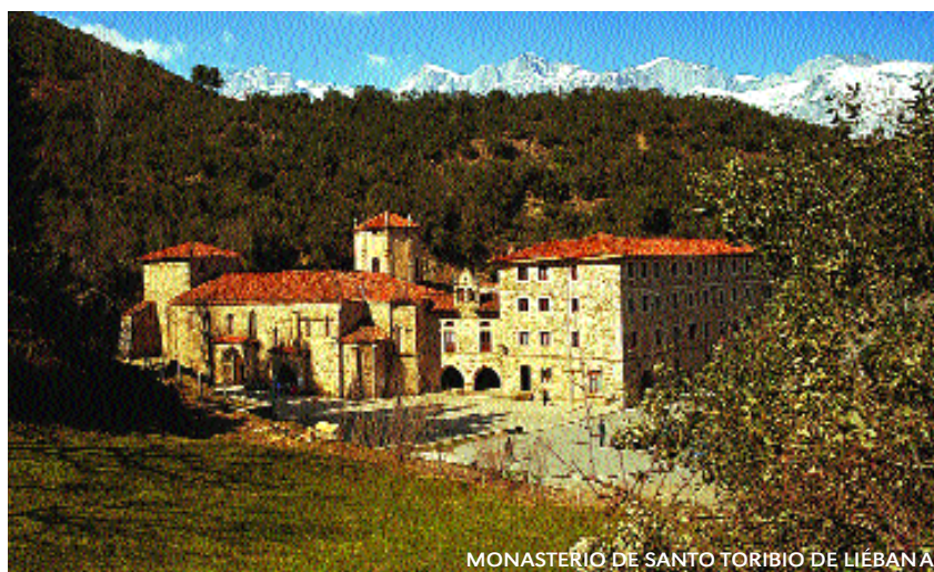
MONASTERIO DE SANTO TORIBIO DE LIÉBANA

A summary of the various aspects of this event, from its religious roots to its cultural and economic implications.