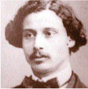
JESÚS DE MONASTERIO