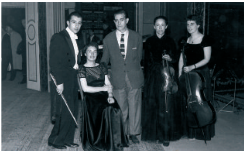
ARTURO DÚO VITAL WITH THE INSTRUMENTAL QUARTET OF PARIS, PAMPLONA, MAY 1956.