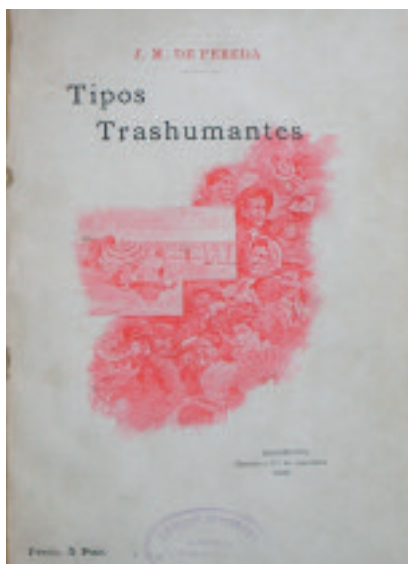
CUBIERTA ORIGINAL. ORIGINAL COVER.

Pereda y su mundo muestra alrededor de 250 piezas, muchas de ellas inéditas, procedentes de instituciones y museos públicos y colecciones privadas, de Cantabria y del resto de España. El montaje de Macua & García Ramos trabaja el espacio de las Casas del Águila y la Parra para mostrar elementos diversos: desde bibliografía -manuscritos y ediciones de Pereda y sus contemporáneos- a correspondencia, hemeroteca, iconografía propia y de la Cantabria de la época, etcétera, así como de sus amigos próximos y de sus compañeros de generación. La visión de su mundo y de los ambientes de su literatura se plasma plásticamente, además, en pie-