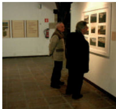
EXPOSICIÓN PEREDA Y SU MUNDO. PEREDA AND HIS WORLD EXHIBITION.