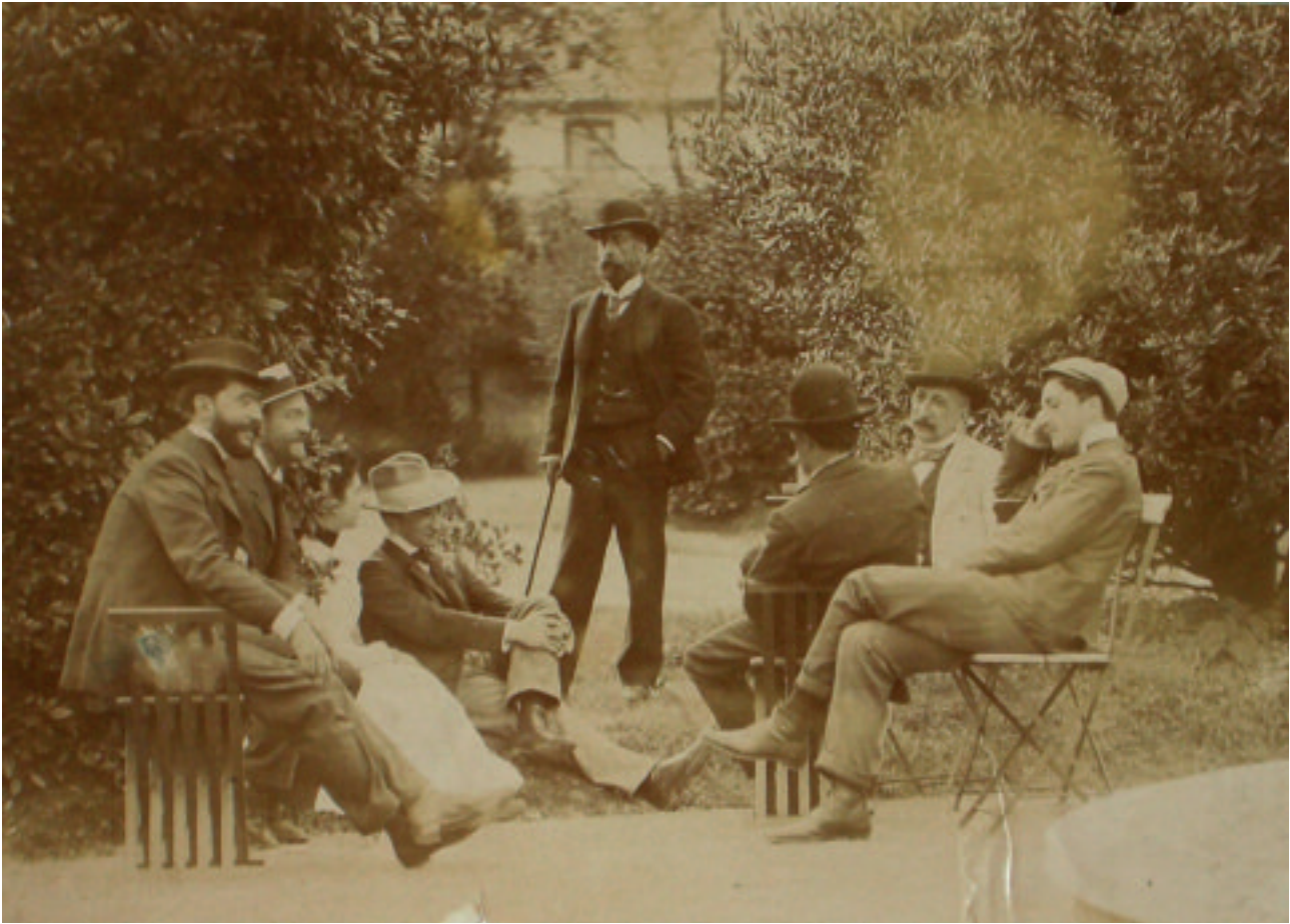
TERTULIA EN EL JARDÍN DE LA CASA DE PEREDA EN POLANCO. GATHERING IN THE GARDEN OF THE PEREDA HOUSE IN POLANCO.

B. PÉREZ GALDÓS, E. PARDO BAZÁN Y M. MENÉNDEZ PELAYO, CONTEMPORÁNEOS Y AMIGOS DEL ESCRITOR.