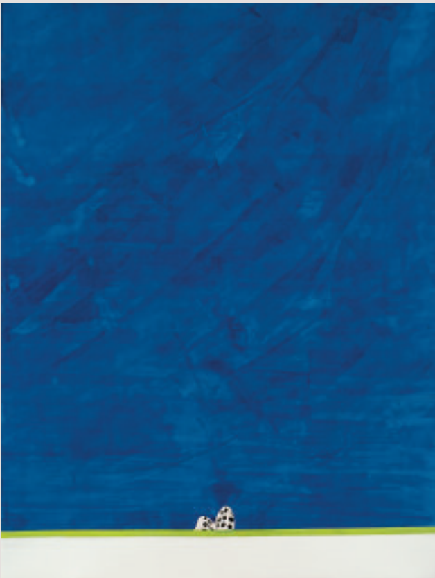
VICKY USLÉ TRUGEDA

These images were captured during his walks in the Cantabrian countryside. The objects and materials used by the artist acquire new uses, far different from their original function: "... Swimming costumes, sprung bed bases, cans and industrial elements to create huts, shelters, chairs, drinking troughs, doors, fences... The objects are extracted from their normal environment (urban and private spheres), stripped of their use value for which they were invented and, little by little, patiently absorbed and integrated into the landscape until they become elements of a new rural daily life".