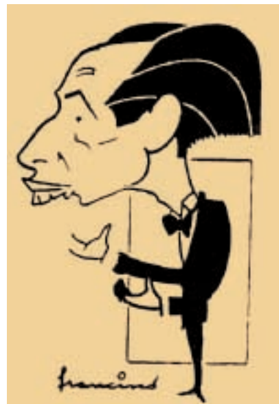
CARICATURE OF THE PERIOD OF FRANCISCO VÁZQUEZ TURUSETA.

“LLEGARON A GRABAR DOS DISCOS PARA DOS DE LOS SELLOS DISCOGRÁFICOS MÁS EMBLEMÁTICOS DE ENTONCES, ODEÓN Y LA VOZ DE SU AMO, EN 1958”