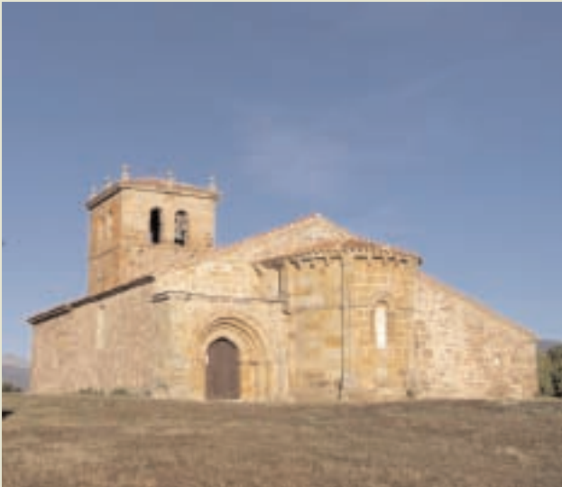
CENTRO DE INTERPRETACIÓN DEL ROMÁNICO EN VILLACANTID.