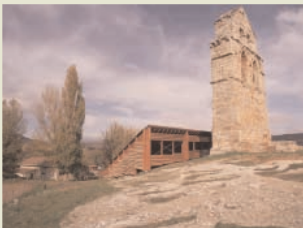
SANTA MARÍA DE VALVERDE.

Desde la vertiente funcional y operativa, la gestión de esta red de centros se ha encomendado a la dirección del Museo de Prehistoria y Arqueología de Cantabria. Esta institución se hace cargo de las excavaciones de Camesa, de su reacondicionamiento, de los contenidos nuevos del arqueosítio, de la gestión y dinamización de la Domus Romana de Julióbriga, del mantenimiento de este yacimiento, de la museografía que se creó para Villacantid, del centro del rupestre y de los proyectos que están en ejecución. Se concibe la iniciativa como una prolongación del museo por cuanto es éste el referente para depósito del patrimonio arqueológico de la Comunidad. Se trabaja desde la idea de un museo de museos, de modo que éstos creen sinergias y enlaces que activen y relancen visitas hacia los distintos centros.