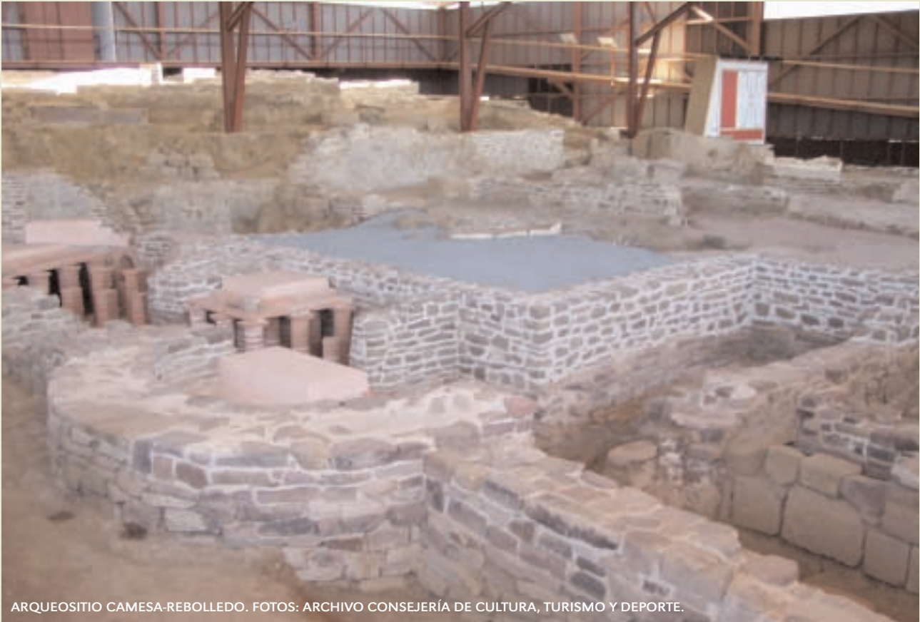
ARQUEOSÍTIO CAMESA-REBOLLEDO.

(guides, maintenance staff...) and become a means of economic activation that hopes to attract visitors and de-seasonalize tourism in order to make it a driving force for development.