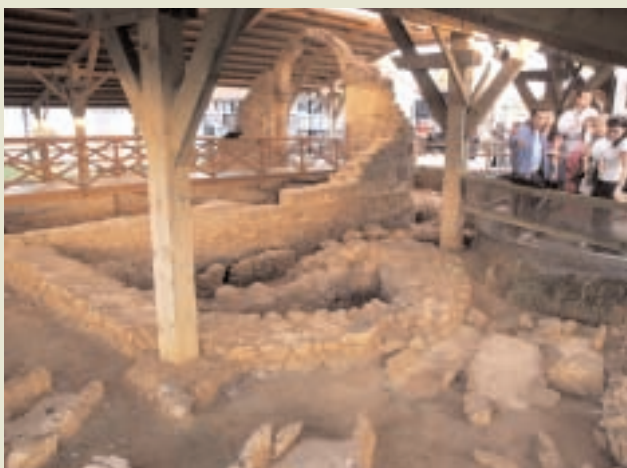
ARQUEOSITIO CAMESA-REBOLLEDO.

causto y un panel de pintura mural para facilitar la interpretación del yacimiento por parte del visitante. Los contenidos del centro de interpretación se han concebido desde una perspectiva didáctica que se sirve de la foto aérea y la infografía para la interpretación del territorio y la presentación al público del conjunto del asentamiento.