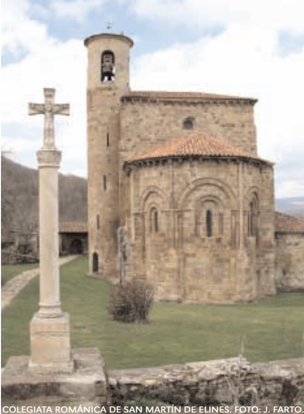
COLEGIATA ROMÁNICA DE SAN MARTÍN DE ELINES.

1.800.000) y, por otro, lo sembrado para el futuro , es decir, el Año Santo Lebaniego es ya un referente para sus posteriores celebraciones y ha contribuido a cambiar la imagen de Cantabria y a posicionarla en el mapa, sin olvidar que su conmemoración también ha servido para restaurar y mejorar el patrimonio de Liébana.