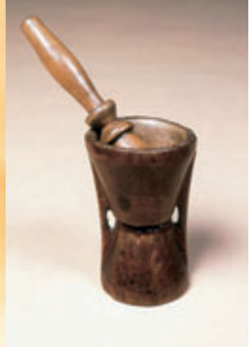
ESPECIERO, SILLA, MORTERO Y CUCHARA REALIZADOS ARTESANALMENTE EN MADERA.