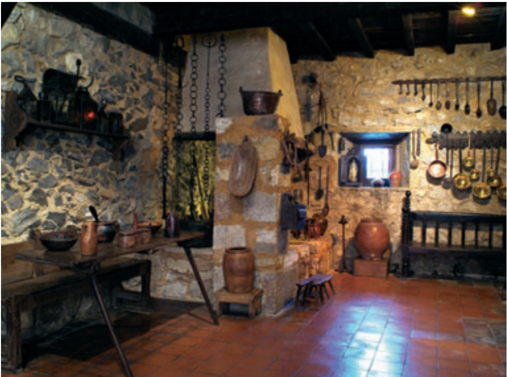
ROOM SHOWING THE KITCHEN AND ITS TRADITIONAL FURNITURE. A.F.M., AUTHOR: JORGE FERNÁNDEZ BOLADO.