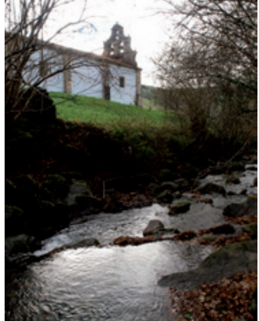
SANTUARIO DE LA VIRGEN DE VALVANUZ.

En Santa María de Cayón se concentran dos interesantes muestras del románico comarcal: San Andrés en